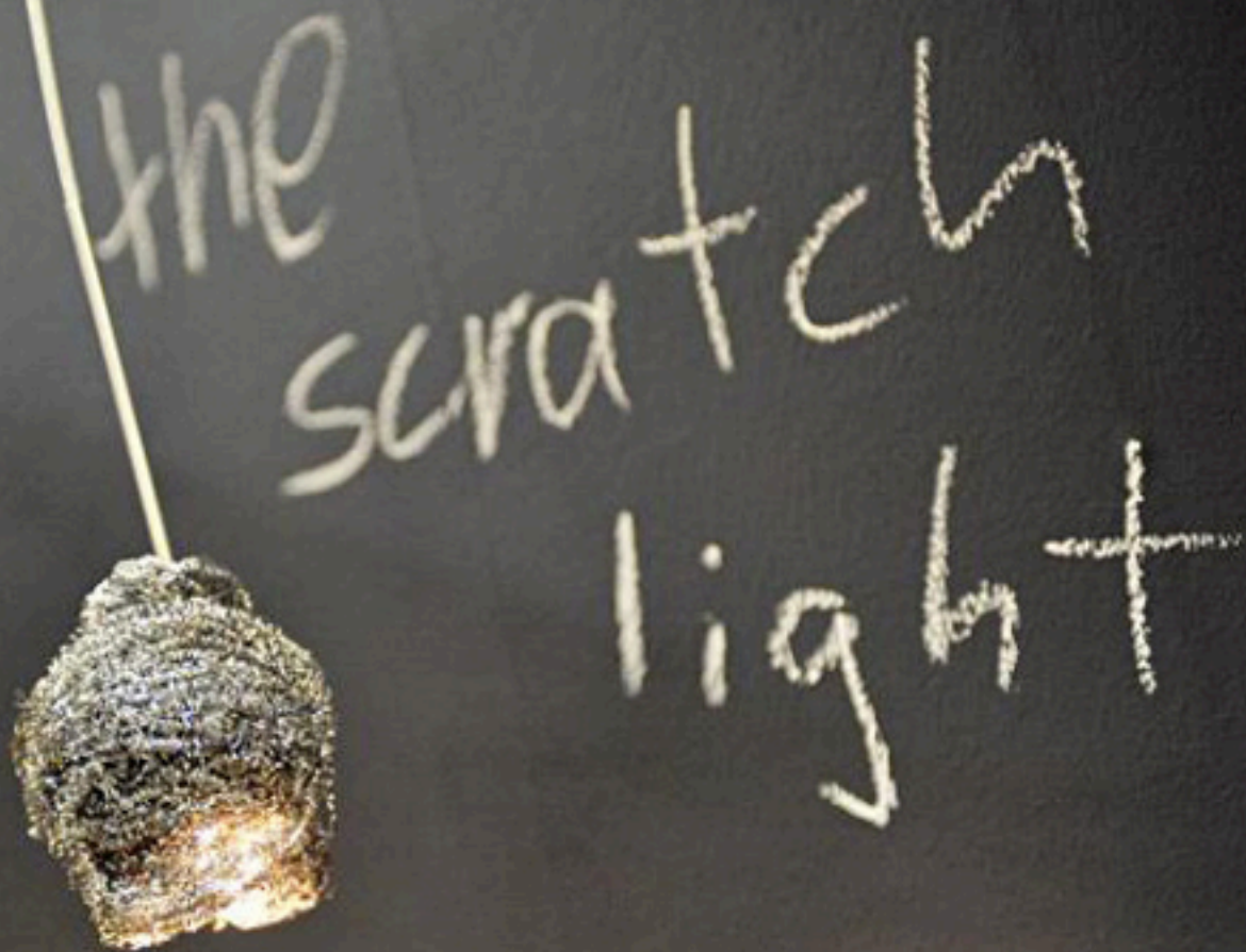
조명기구 <Scratch Light>, 디자인 및 제작: Dodolivin