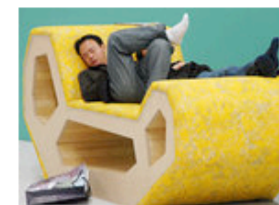
Ital sofa (Messe)

Er ist beiderlei Geschlechts und Deutschland ist sein Biotop. Geht eines seiner zweckdienlichen, massenproduzierten Verwahr Möbel kaputt, findet er das gleiche totsicher, wenn er den 70-%-Rabatt-Anzeigen in die Industriegebiete folgt. Trotzdem gibt es in Köln eine imposante Möbelmesse und im Land eine florierende Industrie, die 2007 ein Umsatzplus von fünf Prozent verzeichnete. Das verdankt sie dem Auslandsmarkt, der um 16 Prozent gewachsen ist.